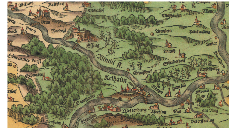
Ausschnitt aus Apian-Landtafel 10

Format: 43 cm x 33 cm Maßstab: ca. 1:144 000